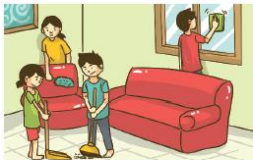
Gambar 5.2 Anak dan orang tua begotong royong membersihkan rumah.

Perhatikanlah gambar berikut ini. Kemudian, ceritakan dan jelaskan yang kamu ketahui di depan kelas.