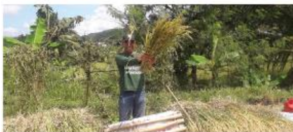
Gambar 5.7 Petani sedang memanen padi