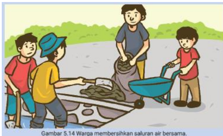
Gambar 5.14 Warga membersihkan saluran air bersama.

Dalam menghadapi musim hujan yang hampir tiba, warga masyarakat Kelurahan Tanah Baru berkumpul dan berdiskusi untuk mengadakan kerja bakti. Mereka berencana membersihkan saluran air karena mereka yakin dan sepakat jika saluran air bersih, perumahan warga tidak akan banjir.