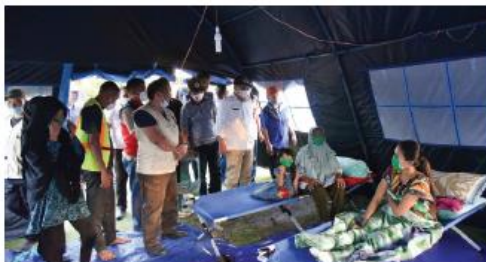
Gambar 5.12 Posko Korban Bencana Alam

Ceritakan kaitan gambar berikut ini dengan kegiatan pembelajaran saat ini di depan kelas!