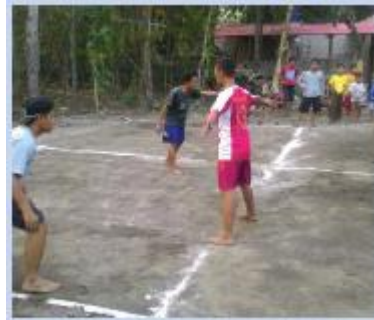
Gambar 5.8 Permainan Gobak Sodor

Para pemain dibagi menjadi 2 kelompok, yakni tim serang dan tim jaga. Setiap tim memilih ketua yang bertugas sebagai sodor dari salah satu anggotanya. Tim serang berkumpul semuanya di pangkalan dan tim jaga bersiap diri di garis-garis pertahanan (melintang) yang telah dipilih oleh ketuanya. Tim serang harus berusaha masuk dan melewati petak-petak tanpa tersentuh tim jaga sehingga dapat berada di belakang garis. Kemudian, akan berusaha kembali lagi ke pangkalan. Jika seorang pemain tim serang bisa kembali lagi ke pangkalan tanpa tersentuh oleh tim jaga maka tim serang yang dinyatakan sebagai pemenang lalu mendapatkan poin.