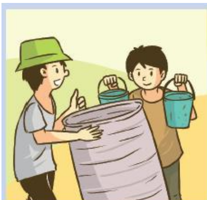
Gambar 5.9 Warga yang menyiapkan barang-barang bekas

Ceritakan kaitan gambar berikut ini dengan kegiatan pembelajaran saat ini di depan kelas!