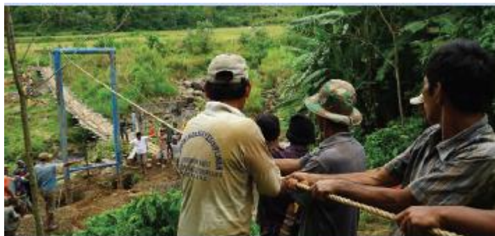
Gambar 5.15 Gotong Royong membangun jembatan

Modal sosial juga didefinisikan sebagai kemampuan dan kapasitas yang muncul dari kepercayaan umum di dalam sebuah masyarakat atau bagian-bagian tertentu dari masyarakat tersebut. Selain itu, konsep ini juga diartikan sebagai serangkaian nilai atau norma informal yang dimiliki bersama di antara para anggota suatu kelompok yang memungkinkan terjalinnya kerjasama dan saling tanggung jawab.