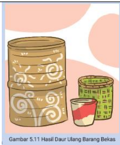
Gambar 5.11 Hasil Daur Ulang Barang Bekas