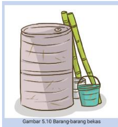
Gambar 5.10 Barang-barang bekas

Sementara itu, warga yang lain bekerja sejak pagi bergotong royong menyiapkan tempat sampah baru. Ujang, Siti, dan Edi membantu Pak Budi bersama beberapa warga lain menganyam bilah-bilah bambu menjadi keranjang sampah organik. Keranjang ini akan menjadi tempat sampah dari kebun, seperti daun-daun kering, batang, atau buah yang berjatuhan di bawah pohon.