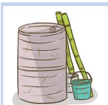
Gambar 5.10 Barang-barang bekas