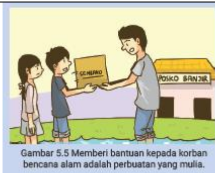
Gambar 5.5 Memberi bantuan kepada korban bencana alam adalah perbuatan yang mulia.

Hidup rukun, saling berbagi dan tolong-menolong adalah perbuatan yang mulia dan membuat hidup kita bahagia. Kita dapat mempunyai banyak teman sehingga kita tidak menjadi sedih dan kesepian karena di sekeliling kita banyak teman yang menemani dalam hidup kita. Selain itu, kita menjadi disayangi oleh orang tua, guru, teman, dan anggota masyarakat lainnya. Hidup rukun, saling berbagi dan saling tolong dengan sesama termasuk nilai-nilai gotong royong.