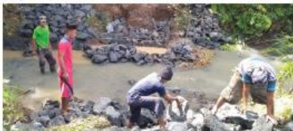
Gambar 5.6 Masyarakat sedang kerja bakti membangun jembatan

Ceritakan kaitan gambar berikut ini dengan kegiatan pembelajaran saat ini di depan kelas!