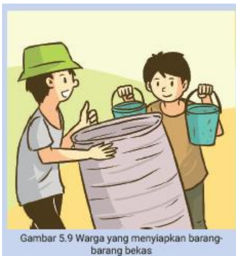
Gambar 5.9 Warga yang menyiapkan barang-barang bekas

Ada yang berbeda setelah senam pagi Minggu ini. Warga sudah berkumpul di lapangan desa dengan membawa peralatan dan perlengkapan kebersihan. Beberapa drum bekas yang kosong, potongan bilah bambu, karung plastik, dan ember bekas nampak tersusun di sudut kanan lapangan. Di sudut lain, terlihat tumpukan bekas kaleng, kuas, dan wadah cat serta beberapa barang dan alat yang lain. Kirakira, warga akan mengerjakan apa hari ini?