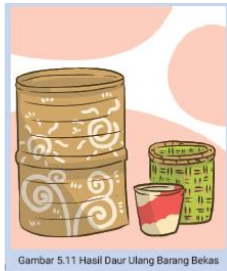
Gambar 5.11 Hasil Daur Ulang Barang Bekas

Sekitar pukul 09.00, Pak Made, Dayu, dan keluarganya sudah kembali dari kegiatan ibadah. Tong-tong sampah baru sudah hampir selesai dan siap untuk dihias. Pak Made dan istrinya, serta Dayu berkeliling membuat pola hiasan untuk tong sampah baru. Lina ikut serta membantu Dayu. Setelah itu, warga bergotong royong mengecat dan mem-perindah hiasan tempat sampah. Sebelum matahari meninggi, sudah ada 15 tong sampah baru yang dihasilkan warga secara bergotong royong. Semua barang bekas seperti drum, ember, dan karung plastik, sudah berubah menjadi keranjang anyam dan tempat sampah yang cantik.