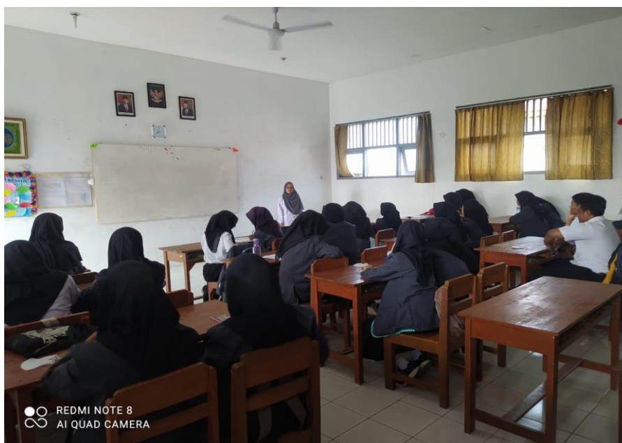
Picture 5. Learning Activities in the Control Class