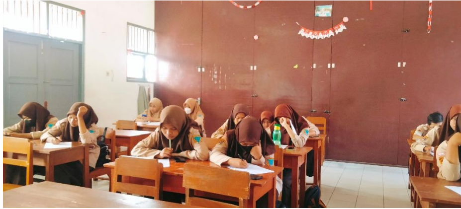
Picture 1. Try out Pretest-Posttest