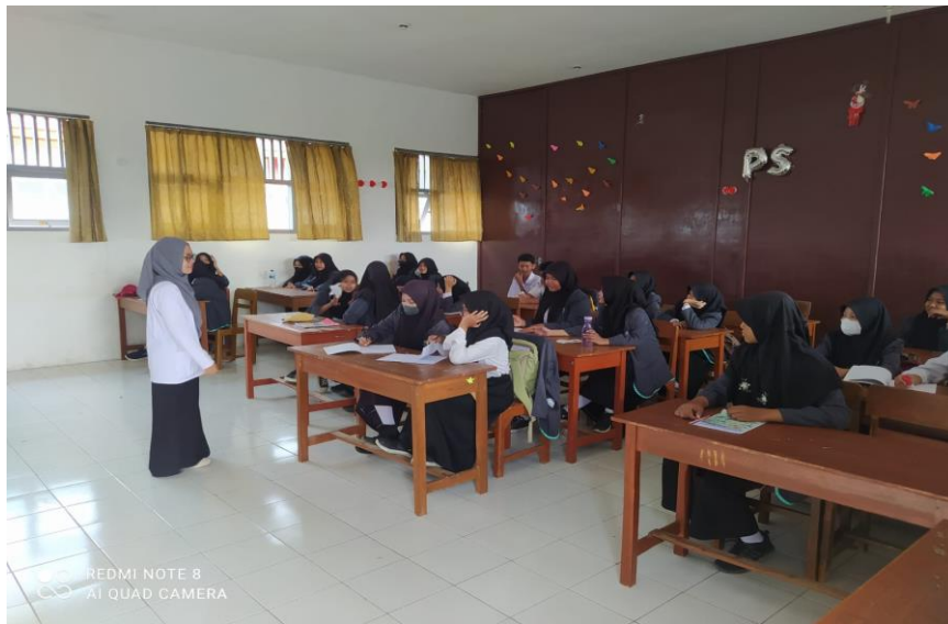
Picture 4. Learning Activities in the Experiment Class