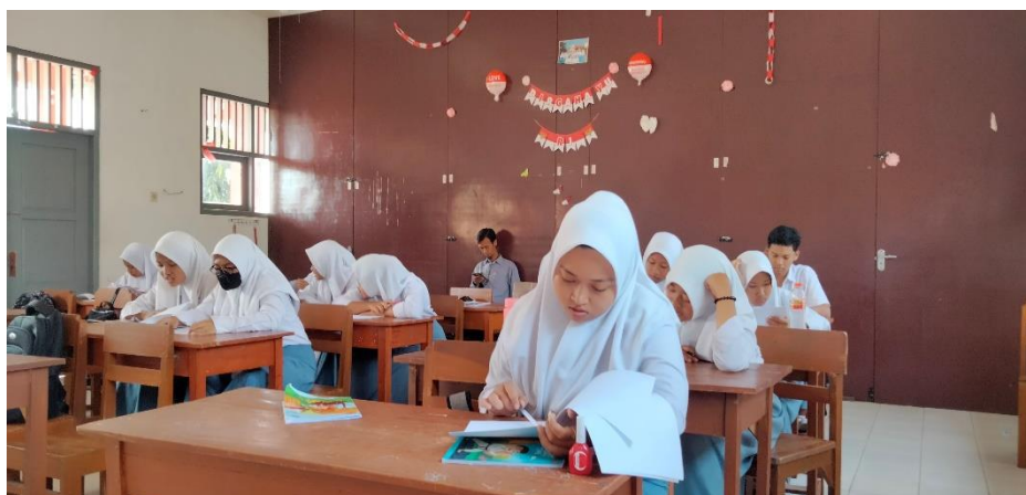
Picture3. Giving Pretest (Control Class)