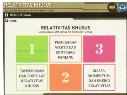
Gambar 2. Desain Produk yang sudah direvisi

Pengembangan desain Produk yang perlu dibahas mengenai penggunaan warna, pemilihan warna sangat penting dalam