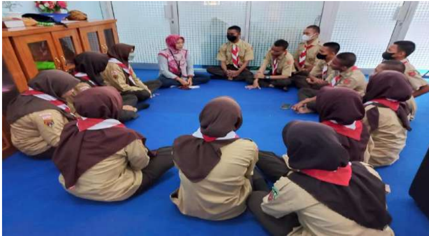
Gambar 7. Layanan bimbingan kelompok di SMK Negeri 1 Adiwerna