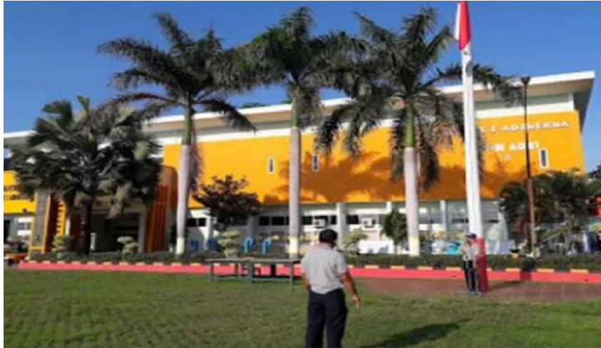
Gambar 2. SMK Negeri 1 Adiwerna tampak depan