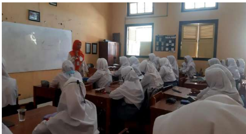
Gambar 12. Pembelajaran layanan klasikal di SMK Negeri 1 Dukuhturi