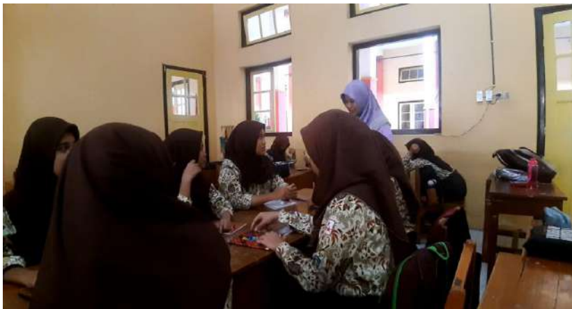
Gambar 14. Layanan bimbingan kelompok di SMK Negeri 1 Dukuhturi