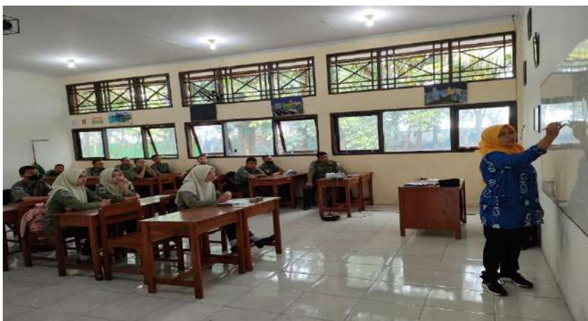
Gambar 6. Pembelajaran layanan klasikal di SMK Negeri 1 Adiwerna