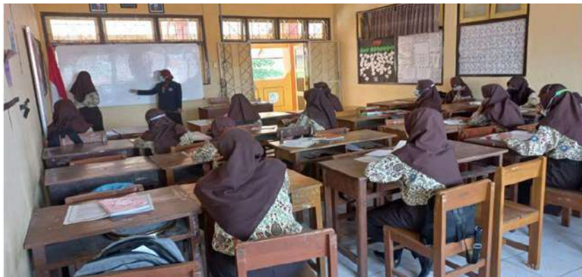
Gambar 11. Pembelajaran layanan klasikal di SMK Negeri 1 Dukuhturi