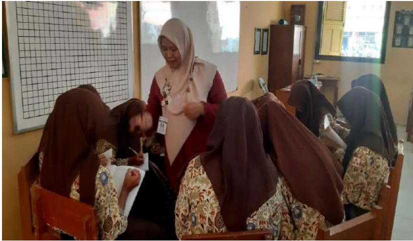
Gambar 16. Layanan bimbingan kelompok di SMK Negeri 1 Dukuhturi