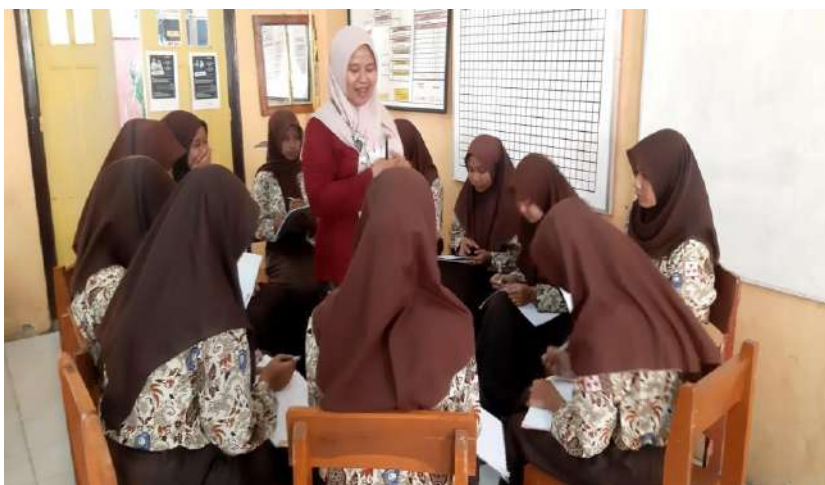
Gambar 18. Layanan bimbingan kelompok di SMK Negeri 1 Dukuhturi