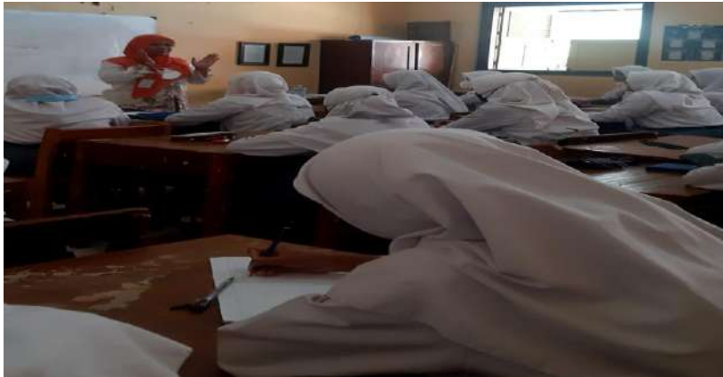
Gambar 13. Pembelajaran layanan klasikal di SMK Negeri 1 Dukuhturi