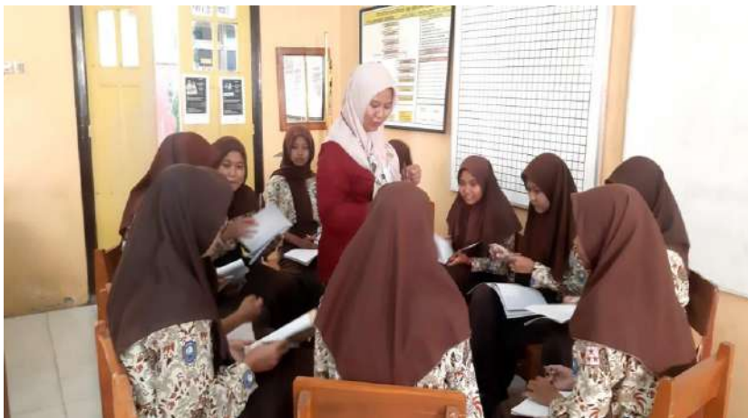
Gambar 17. Layanan bimbingan kelompok di SMK Negeri 1 Dukuhturi