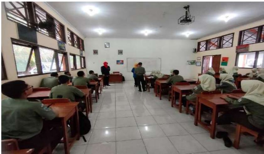
Gambar 3. Pembelajaran layanan klasikal di SMK Negeri 1 Adiwerna