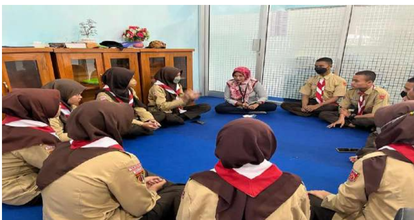
Gambar 9. Layanan bimbingan kelompok di SMK Negeri 1 Adiwerna