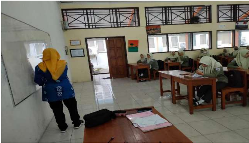
Gambar 4. Pembelajaran layanan klasikal di SMK Negeri 1 Adiwerna