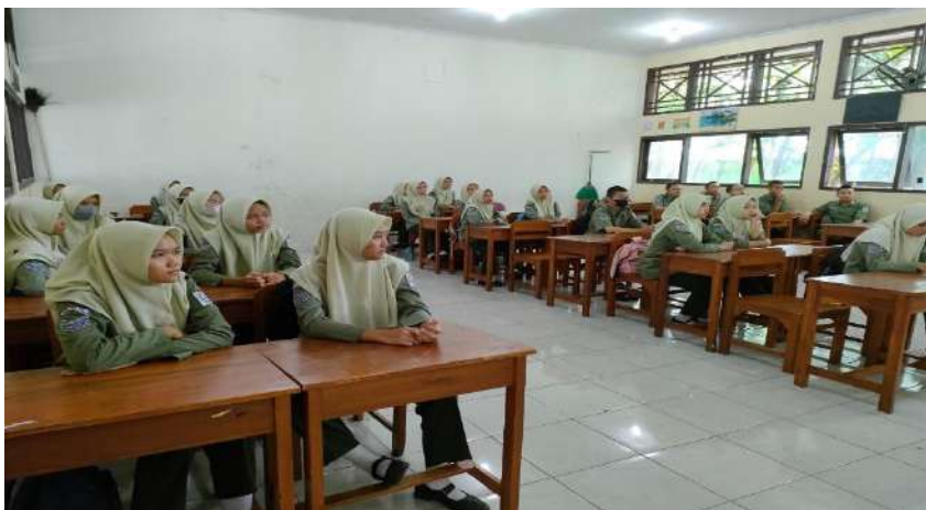
Gambar 5. Pembelajaran layanan klasikal di SMK Negeri 1 Adiwerna