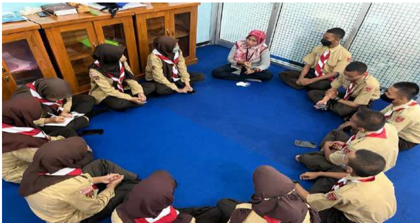
Gambar 8. Layanan bimbingan kelompok di SMK Negeri 1 Adiwerna