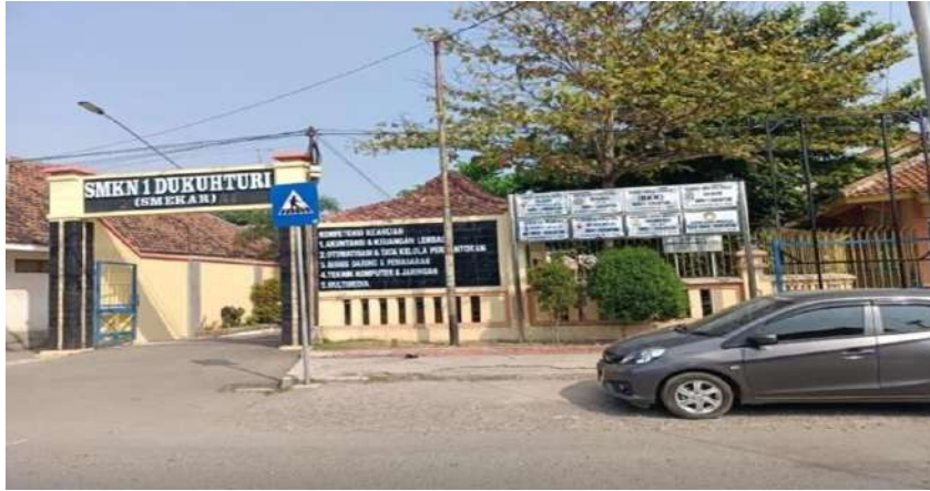
Gambar 10. SMK Negeri 1 Dukuhturi tampak depan