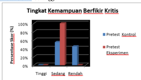
Gambar 3. Hasil Pretest Tingkat Kemampuan Berpikir Kritis Peserta Didik

Dengan dipkannya pembelajaran Outdoor Activities dengan model pembelajaran Problem Based Learning cukup efektif dan menghasilkan perbedaan yang signifikan terhadap kemampuan berfikir kritis peserta didik. Hasil tersebut diperoleh dari data uji hipotesis yang membuktikan adanya perbedaan yang signifikan dan hasil uji N-gain yang membuktikan bahwa pembelajaran Outdoor Activities dengan model Problem Based Learning cukup efektif digunakan pada pembelajaran untuk melihat kemampuan berfikir kritis peserta didik dibanding hasil penelitian pada kelas kontrol yang hanya menggunakan model pembelajaran Problem Based Learning. Maka dari hasil uji yang telah dibahas pada analisis data diatas model pembelajaran Outdoor Activities dengan model pembelajaran Problem Based Learning dapat memberikan dampak positif terhadap perilaku peserta didik dilingkungan dan keseharian. Maka tujuan pembelajaran yang diantaranya meningkatkan rasa ingin tahu, rasa cinta terhadap lingkungan dan disiplin maka akan meningkat dan dengan hal itu tentu berpengaruh terhadap keadaan lingkungan sekitar sehingga pencemaran air dilingkungan yang ada dapat teratasi dan mengurangi pencemaran.