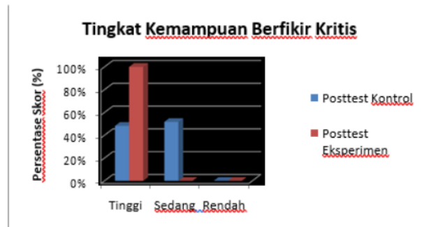
Gambar 4. Hasil Posttest Kemampuan Berfikir Kritis Peserta Didik

memiliki kemampuan berfikir kritis dengan kategori Rendah. Sedangkan pada kelas eksperimen memperoleh sebesar 100% dengan kategori Sedang artinya sebanyak 29 peserta didik memiliki kemampuan berfikir kritis Sedang. Hasil analisis berfikir kritis pada keadaan akhir atau posttest dapat dilihat pada Gambar 4.