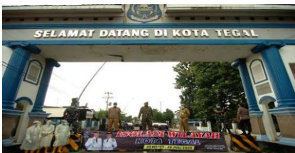
Gambar 1. Suasana kegiatan Isolasi Wilayah/ Lock Down Lokal Kota Tegal

hingga bulan April tahun 2022 tercatat kasus positif covid sejumlah 7184, dan lebih dari 300 orang diantaranya meninggal (D. K. K. Tegal, 2020). Ada banyak hal yang dipertimbangkan Walikota hingga memutuskan untuk lockdown lokal, salah satu pertimbangannya adalah lebih memprioritaskan keselamatan kesehatan warganya, atau mencoba mempertahankan aktivitas perekonomian yang berarti tidak ada pengurangan mobilitas warganya akhirnya dapat menjadi kerumunan seperti yang disampaikan Sekretaris Daerah Kota Tegal saat wawancara. Hingga pada akhirnya, berdasarkan hasil rapat Satgas Penanganan Covid-19 Kota Tegal bersama Forkopimda menetapkan bahwa Kota Tegal masuk zona merah pada awal tahun 2020. Ketetapan tersebut membuat jalan akses masuk Kota Tegal ditutup termasuk di lingkungan perkampungan/ gang perumahan juga di MBC beton bukan lagi water barrier (Safutra, 2020).