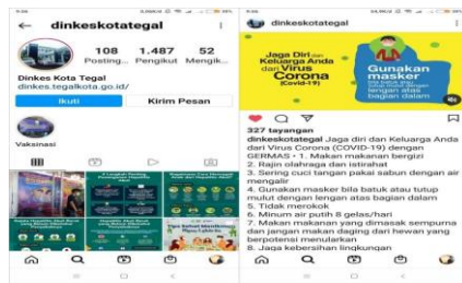
Gambar 5: Akun Media Sosial, Sumber: Instagram resmi Pemkot Tegal sebagai media informasi penanggulangan pandemi COVID-19 .

Adanya website dan akun instagram memberi kemudahan pada masyarakat. Akses informasinya terbuka dimanapun dan kapanpun dengan kata lain 'informasi dalam genggaman'. Berbagai informasi edukatif seperti update kasus, data rumah sakit rujukan covid & penerapan proses selama pandemi tersaji rapi pada kedua media. Pada akun instagram @dinkeskotategal misalnya, menyajikan video cara menjaga diri dan keluarga selama masa pandemi yang telah dilihat lebih dari 320 kali tayangan. Hal tersebut menandakan akun tersebut mendapatkan respon positif dari