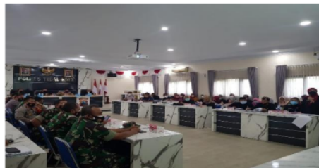
Gambar 2. Rapat Kordinasi Penanggulangan Covid-19.