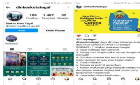
Gambar 4. Akun Instagram Dinkes Kota Tegal

Gambar 3 dan 4 adalah tampilan media yang digunakan untuk menyajikan informasi dan memungkinkan terjadinya interaksi dengan warga kota Tegal dalam rangka penanggulangan pandemic covid-19, bersumber dari website dan akun Instagram resmi yang dikelola Pemkot Tegal. Selain website dan Instagram, media lainnya adalah Radio LPPL Sebayu FM Tegal 94YA, dengan visi sebagai wahana pencerahan dan sentra berita lokal terpercaya, radio Sebayu telah menjadi salah satu andalan Pemkot Tegal sebagai sumber informasi