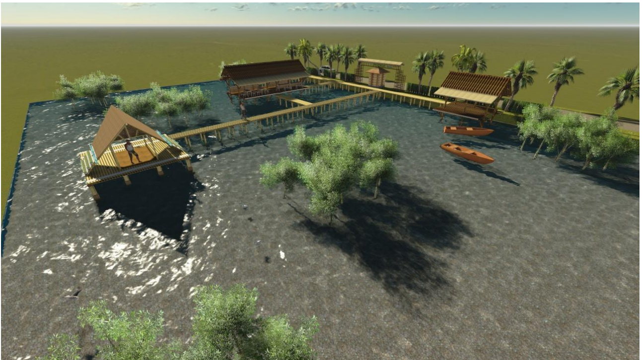
MASTER-PLAN KAWASAN EKOWISATA MANGROVE