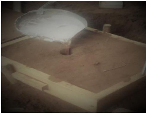
Gambar 4.4. Proses Penuangan Kedalam Cetakan

- Setelah bahan material baja S 45 C mencair langsung tuangkan kedalam cetakan yang sudah dipersiapkan sampai penuh lalu tunggu beberapa menit seperti Gambar 4.