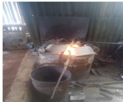
Gambar 3. Proses Peleburan Material Baja S 45 C