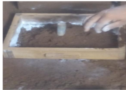
Gambar 2. Proses Pembuatan Cetakan