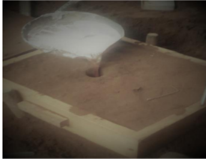
Gambar 4.4. Proses Penuangan Kedalam Cetakan