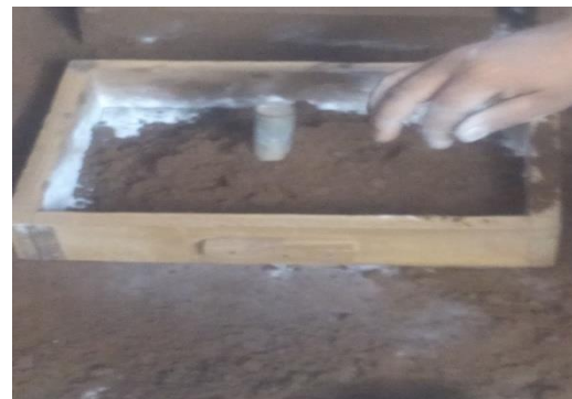
Gambar 2. Proses Pembuatan Cetakan - Setelah selesai membuat cetakan, kemudian melebur bahan material baja S 45 C dengan menggunakan dapur khusus untuk peleburan besi di UD. Kelana Logam seperti Gambar 3.