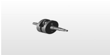
Gambar 1. Desain Poros Engkol

Desain gambar poros engkol yang akan dibuat dengan menggunakan material baja S 45 C dapat dilihat pada Gambar 1.