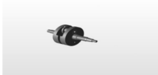
Gambar 1. Desain Poros Engkol

Desain gambar poros engkol yang akan dibuat dengan menggunakan material baja S 45 C dapat dilihat pada Gambar 1.