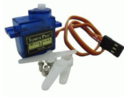
Gambar 4. Bentuk fisik motor servo