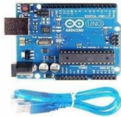
Gambar 1. Arduino Uno

Salah satu kelebihan dari mikrokontroler Arduino adalah kemudahan dalam mengatur dan mengendalikan input dan output digital dan analog, sehingga dapat diaplikasikan dalam berbagai macam proyek seperti pembuatan sistem kontrol, sistem monitoring, sistem otomatisasi, dan proyek-proyek lainnya. Selain itu, mikrokontroler Arduino juga dapat digunakan sebagai alat pembelajaran dalam mempelajari dasar-dasar elektronika dan pemrograman.