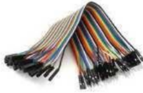
Gambar 2. Kabel jumper

Kabel jumper tersedia dalam berbagai panjang dan warna, dan dapat di beli di toko komponen elektronik atau toko online yang menyediakan perlengkapan untuk proyek elektronik.