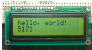
Gambar 5. Bentuk fisik LCD

Layar LCD digunakan dalam berbagai aplikasi, termasuk dalam perangkat elektronik seperti smartphone, laptop, TV, kamera digital, dan perangkat elektronik lainnya. Layar LCD memiliki keuntungan dibandingkan dengan teknologi layar tampilan lainnya, seperti tampilan CRT (Cathode Ray Tube), yaitu lebih tipis, lebih ringan, dan lebih hemat energi. Selain itu, layar LCD juga dapat menampilkan gambar yang lebih tajam dan memiliki sudut pandang yang lebih luas.