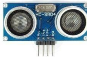
Gambar 3. Sensor ultrasonic

Sensor ultrasonik umumnya digunakan dalam berbagai aplikasi, termasuk dalam kendaraan untuk sistem parkir otomatis, pengukuran level air dalam tangki, dan bahkan dalam pengukuran jarak dalam robotika dan pemrosesan gambar.