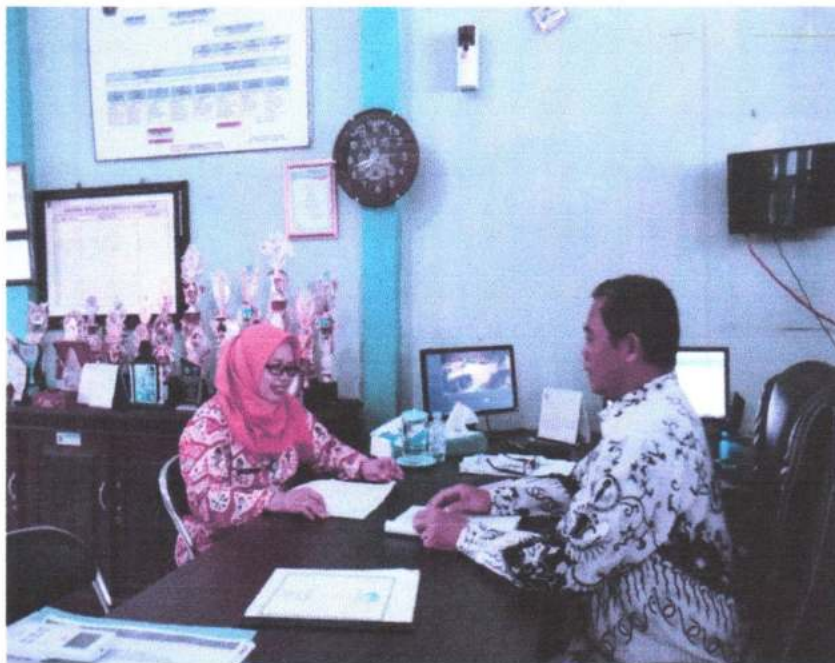
Gambar 2. Wawancara dengan Kepala Sekolah