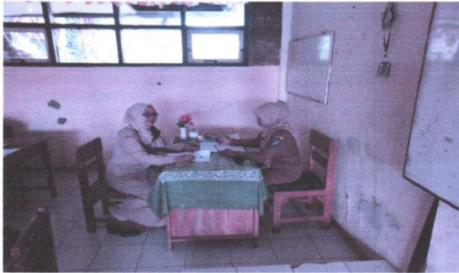
Gambar 5. Wawancara dengan guru IPA