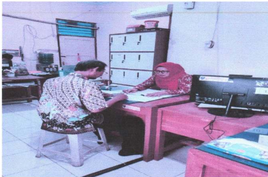
Gambar 7. Wawancara dengan urusan sarpras