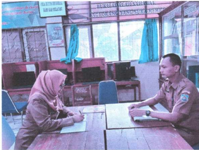
Gambar 3. Wawancara dengan kurikulum