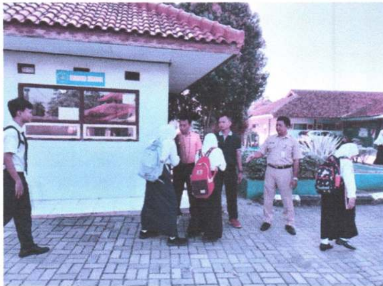
Gambar 12. Budaya 5S ( senyum, salam, sapa, sopan dan santun )