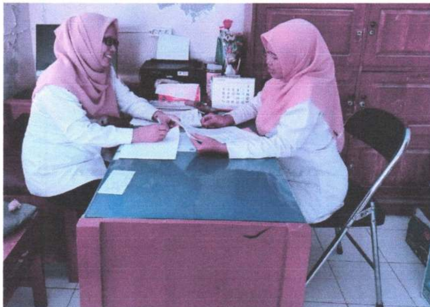
Gambar 6. Wawancara dengan guru IPA