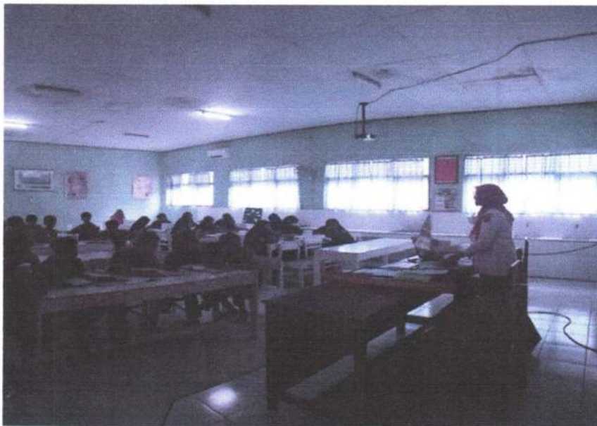
Gambar 10. Observasi pembelajaran IPA