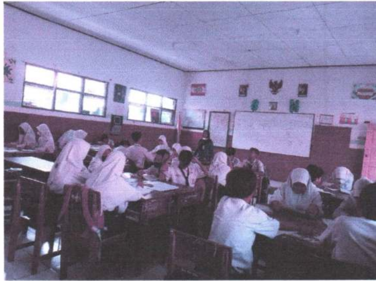
Gambar 11. Observasi pembelajaran IPA