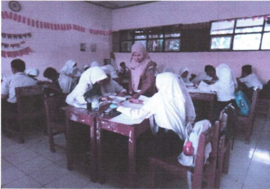
Gambar 9. Observasi pembelajaran IPA