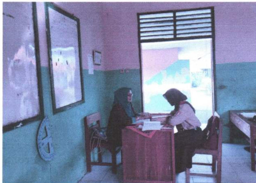
Gambar 8. Wawancara dengan peserta didik