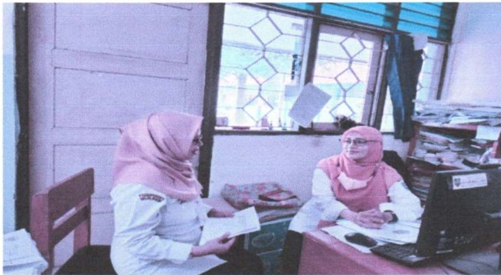
Gambar 4. Wawancara dengan guru IPA