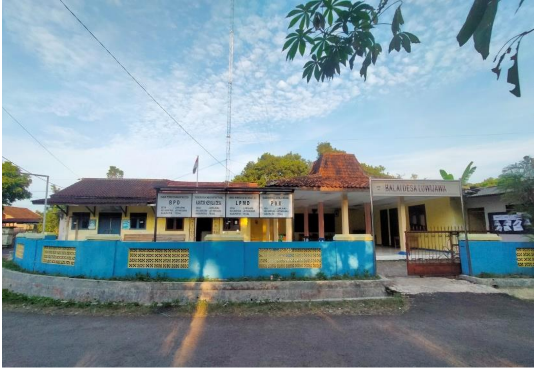
Gambar Kantor Balai Desa Luwijawa