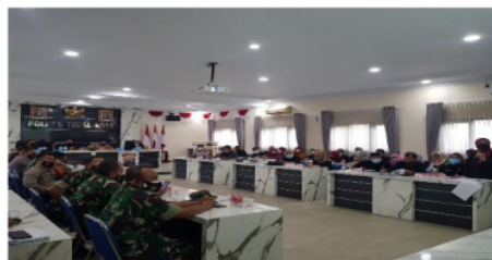
Gambar 2. Rapat Koordinasi Penanggulangan Covid-19.