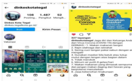
Gambar 4. Akun Instagram Dinkes Kota Tegal

Gambar 3 dan 4 adalah tampilan media yang digunakan untuk menyajikan informasi dan memungkinkan terjadinya interaksi dengan warga kota Tegal dalam rangka penanggulangan pandemic covid-19, bersumber dari website dan akun Instagram resmi yang dikelola Pemkot Tegal. Selain website dan Instagram, media lainnya adalah Radio LPPL Sebayu FM Tegal 94YA, dengan visi sebagai wahana pencerahan dan sentra berita lokal terpercaya, radio Sebayu telah menjadi salah satu andalan Pemkot Tegal sebagai sumber informasi