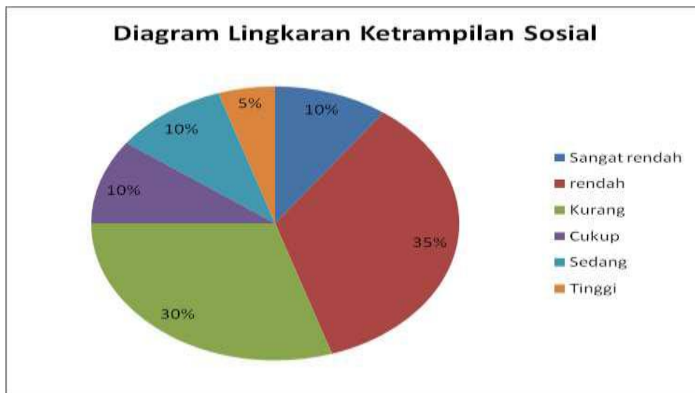
Diagram 4 Diagram Lingkaran Ketrampilan Sosial

Berdasarkan data diatas, dapat ditentukan bahwa hasil penelitian tentang Ketrampilan Sosial kategori sangat rendah sebanyak 2 peserta didik (10%), kategori rendah sebanyak 7 peserta didik (20%), kategori kurang sebanyak 6 peserta didik (30%), kategori cukup sebanyak 2 peserta didik (10%), kategori sedang sebanyak 2 peserta didik (10%) dan kategori tinggi sebanyak 1 peserta didik (5%) .