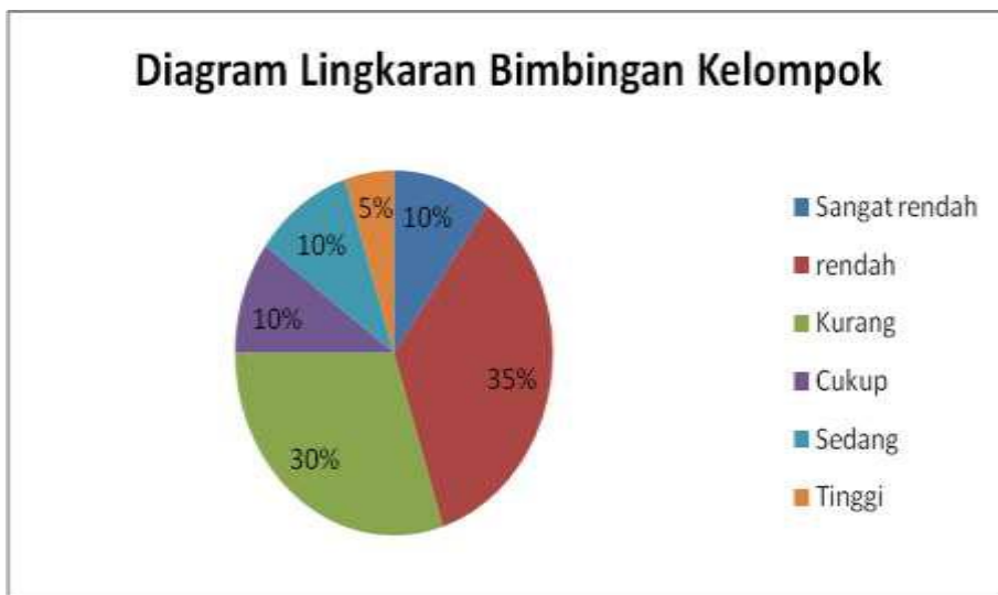
Diagram 2 Diagram Lingkaran bimbingan kelompok

Berdasarkan data di atas, dapat ditentukan bahwa hasil penelitian tentang Bimbingan Kelompok teknik Permainan Simulasi kategori sangat rendah sebanyak 2 peserta didik (10%), kategori rendah sebanyak 5 peserta didik (25%), kategori kurang sebanyak 9 peserta didik (45%), kategori cukup sebanyak 1 peserta didik (5%), kategori sedang sebanyak 2 peserta didik (10%) dan kategori tinggi sebanyak 1 peserta didik (5%) yang diperoleh menggunakan rumus presentase dengan perhitungan sebagai berikut: