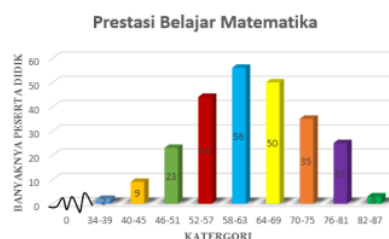
Gambar 3. Diagram Batang Prestasi Belajar

Adapun visualisasi datanya terlihat pada gambar berikut: