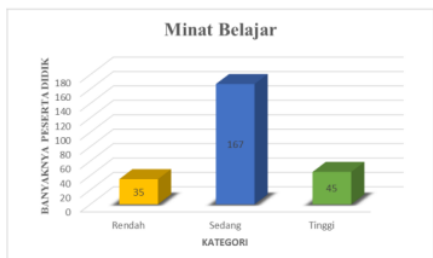
Gambar 3. Diagram Batang Minat Belajar

Adapun visualisasi datanya terlihat pada gambar berikut: