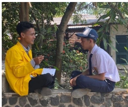
Foto Dokumentasi Konseling Individu Pendekatan Behavior Teknik Desensitisasi Sistematis