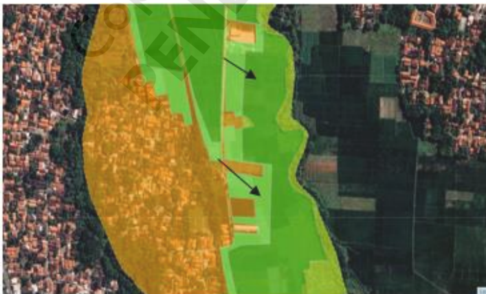
Gambar 7.3 Peta Desa Karanglo Kecamatan Jatibarang