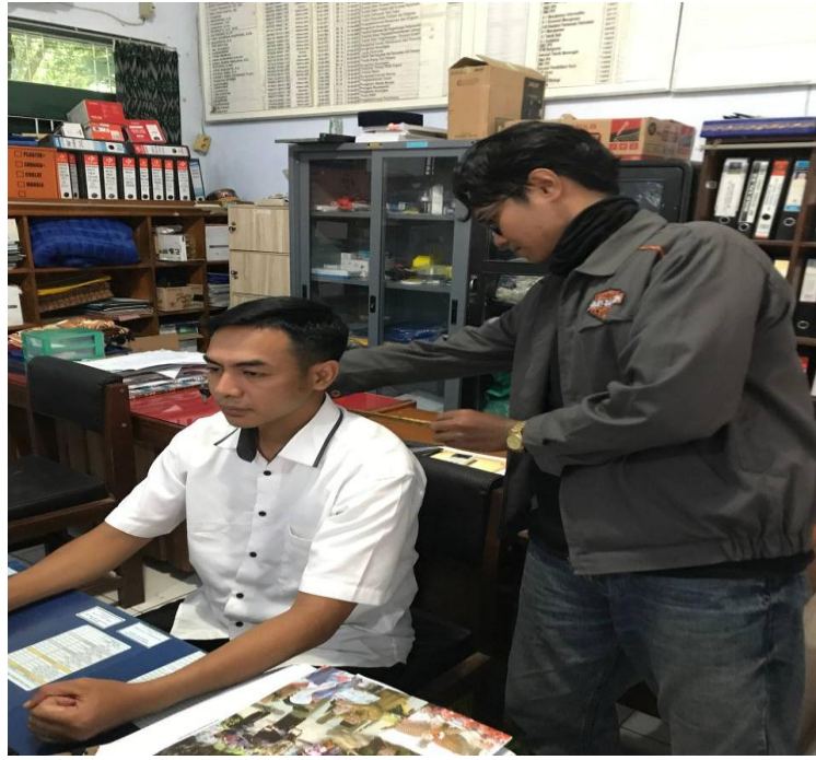
Lampiran 1 Pengukuran Lebar Bahu Kursi Lama