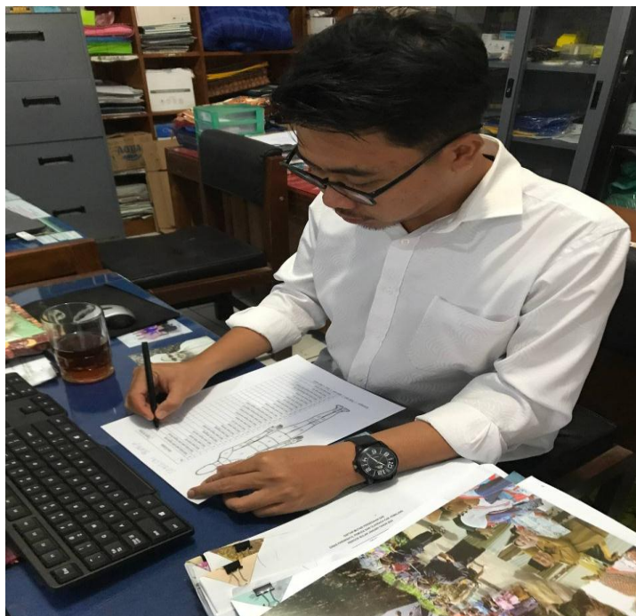
Lampiran 4 Pengisian Kuisiner NBM kursi lama