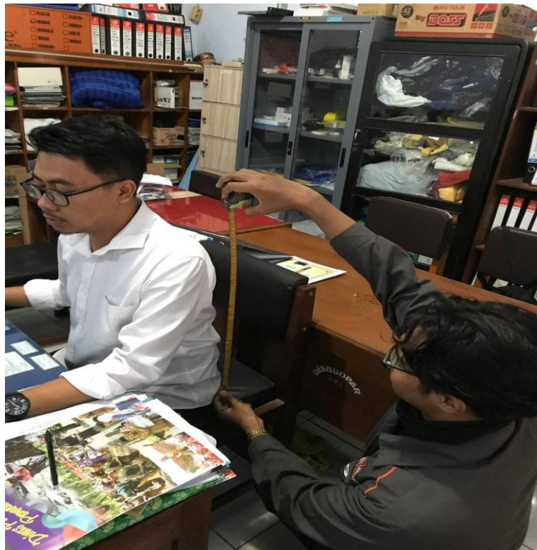
Lampiran 2 Pengukuran tinggi punggung