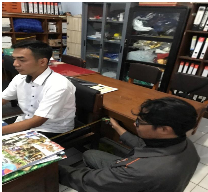
Lampiran 3 Pengukuran panjang dudukan kursi lama