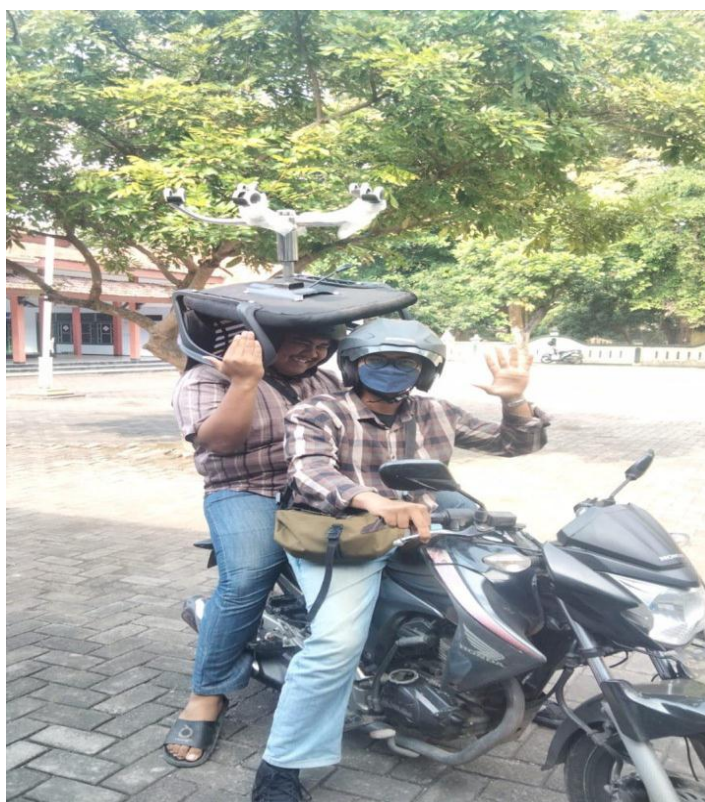
Lampiran 5 Pengantaran kursi baru ke tempat pengujian