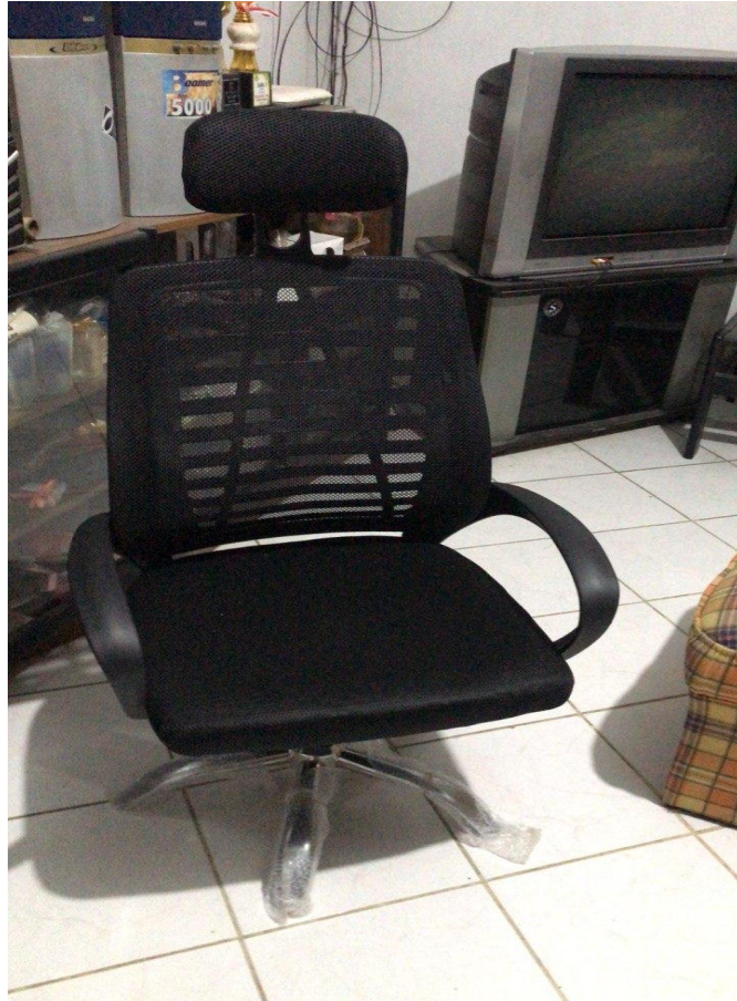
Lampiran 8 Kursi Baru