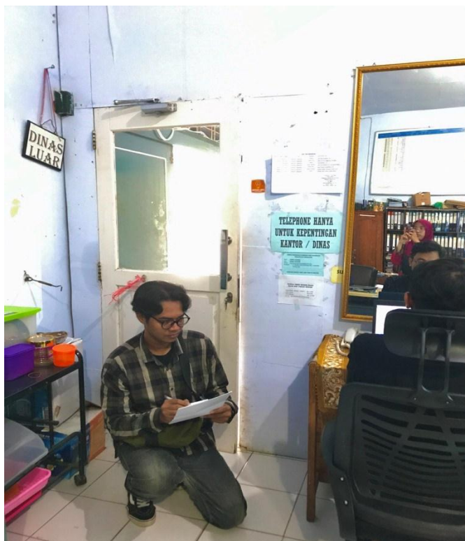
Lampiran 7 Pengisian Skor ROSA kursi baru