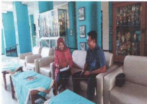
Wawancara dengan waka kesiswaan