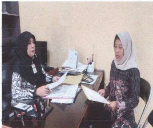
Wawancara dengan kepala sekolah