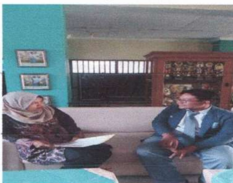
Wawancara dengan siswa