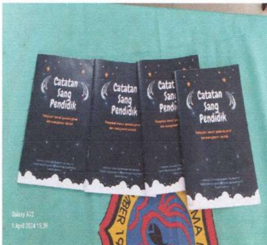
Buku karya siswa