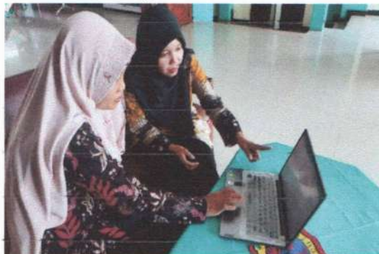
Wawancara dengan guru bahasa Indonesia