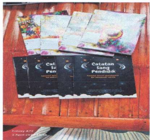
Buku karya siswa