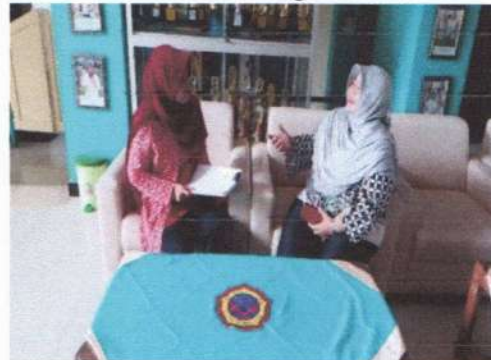
Wawancara dengan guru bahasa Inggris