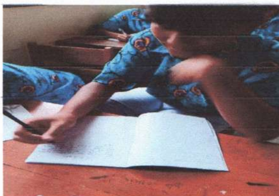
Proses pencatatan hasil literasi