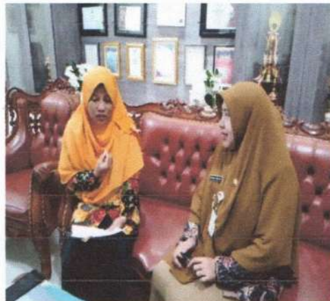
Wawancara dengan ketua Tim literasi