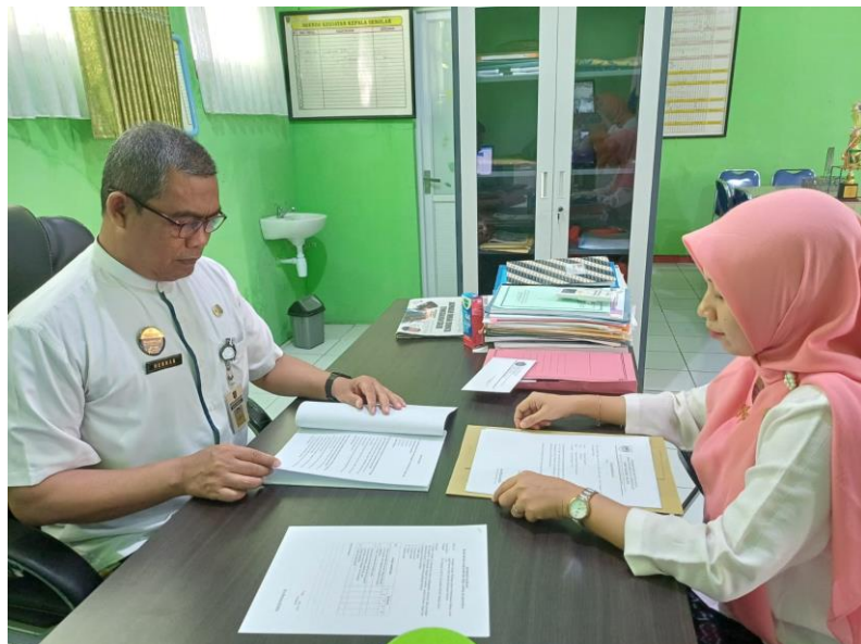
Validasi oleh Pembina/Konsultan MGMP Bahasa Jawa SMP Kab. Tegal