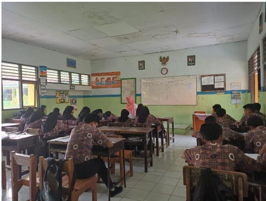
Siswa SMP Negeri 3 Slawi mengerjakan soal Penilaian Literasi Membaca dalam Pembelajaran Bahasa Jawa