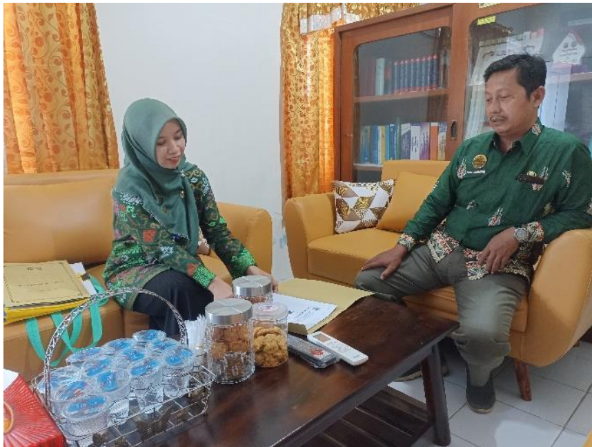
Wawancara dengan Kepala SMP Negeri 1 Dukuhuri