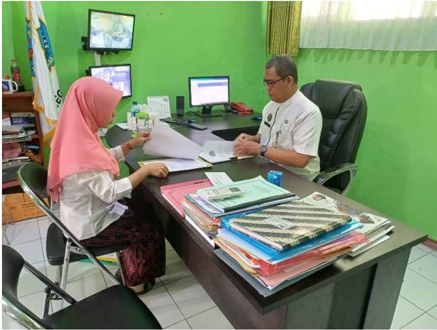
Wawancara dengan Kepala SMP Negeri 3 Slawi