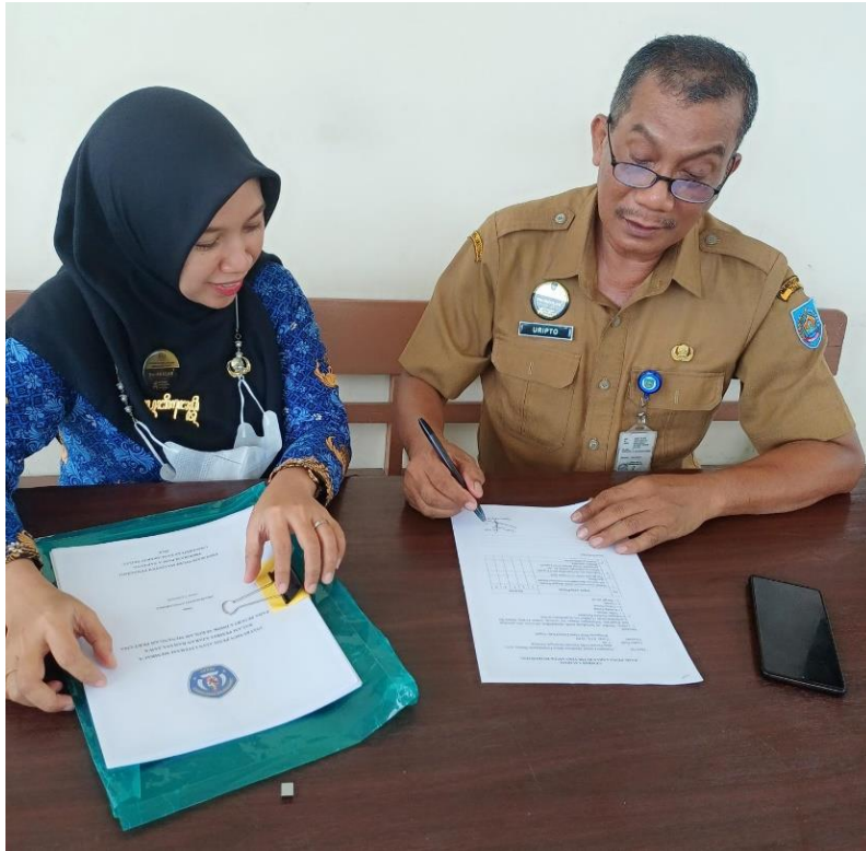
Validasi oleh Pengawas SMP Dinas Dikbud Kab. Tegal