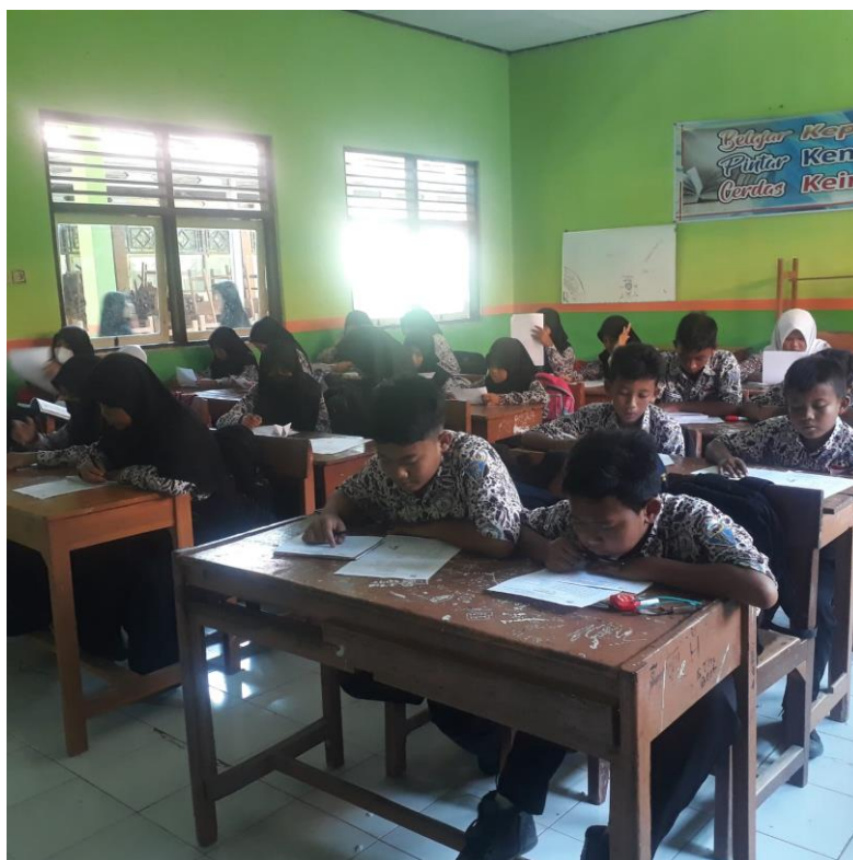
Siswa SMP Negeri 4 Adiwerna mengerjakan soal Penilaian Literasi Membaca dalam Pembelajaran Bahasa Jawa