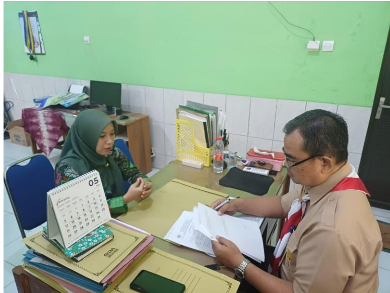
Wawancara dengan Kepala SMP Negeri 4 Adiwerna