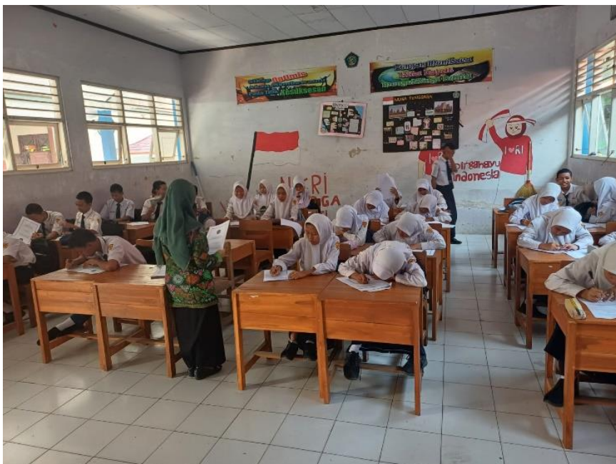
Siswa SMP Negeri 4 Adiwerna mengerjakan soal Penilaian Literasi Membaca dalam Pembelajaran Bahasa Jawa