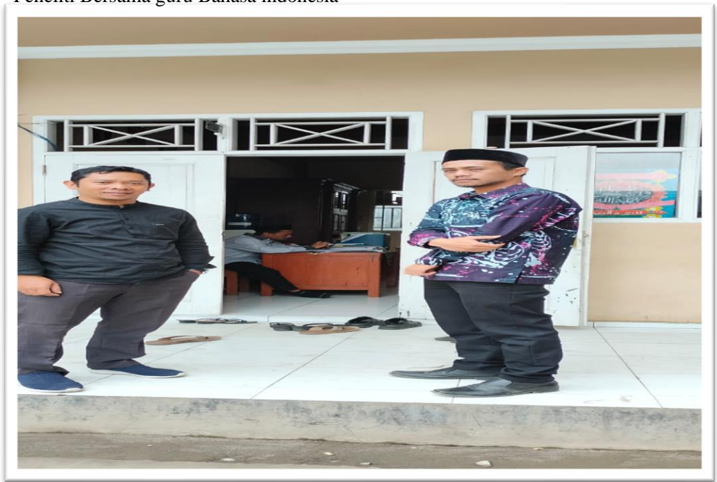
Peneliti Bersama guru Bahasa indonesia