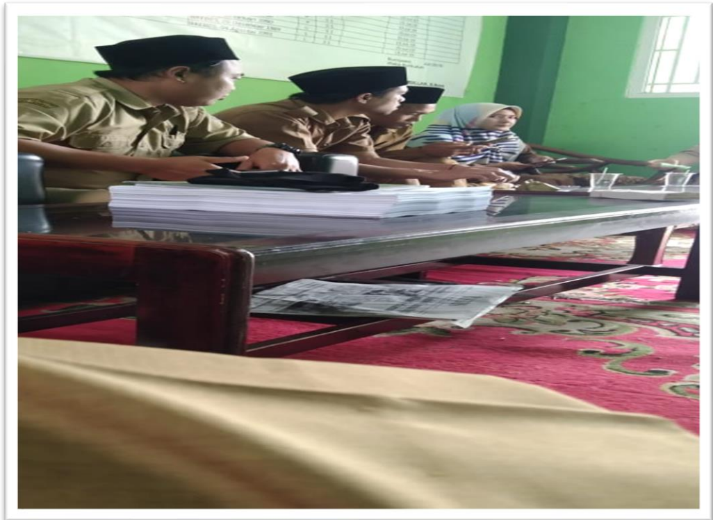
Peneliti saat pengambilan data di SMP Maarif 3 Tarbiyatut Tholibin