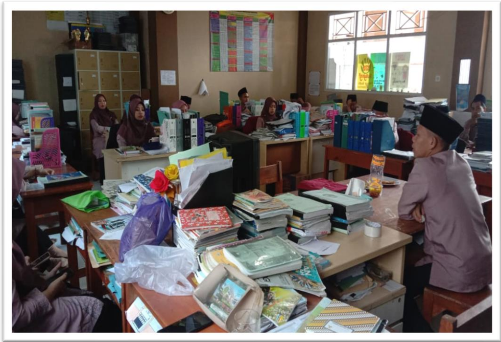
Peneliti saat bersama dengan dewan guru