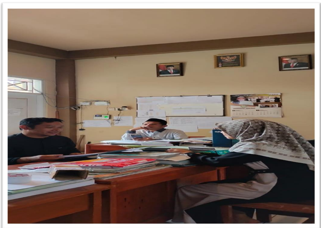
Peneliti sedang menggali data dengan waka kurikulum