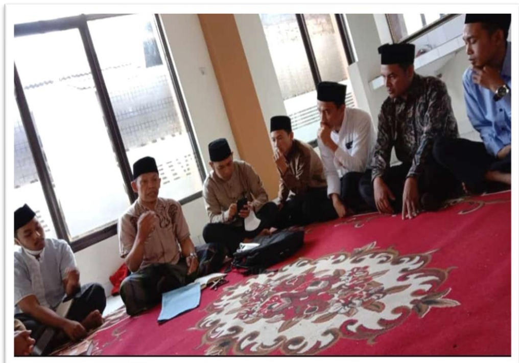
Peneliti saat wawancara dengan dewan guru