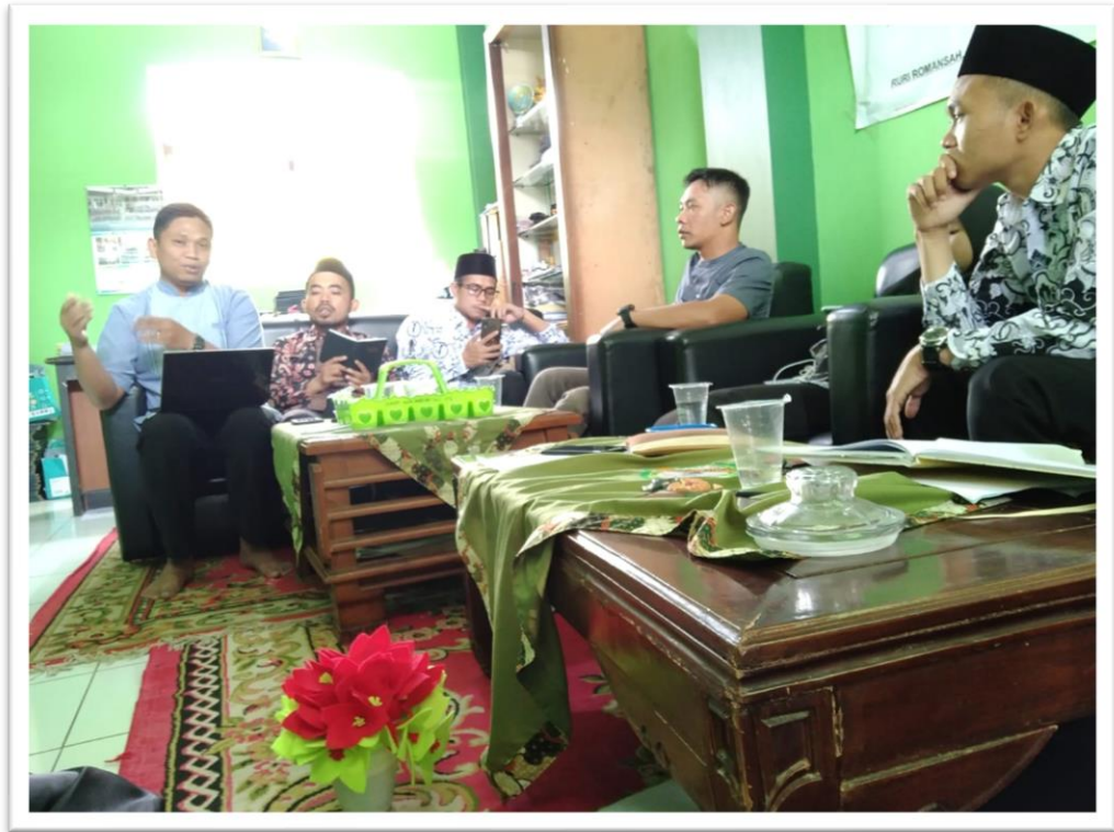
Peneliti saat wawancara dengan guru TIK, Bahasa Inggris