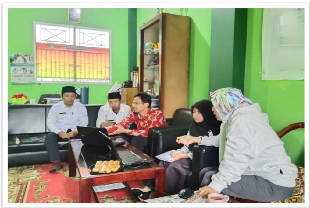
Peneliti saat wawancara dengan guru IPS di SMP Maarif 3 Tarbiyatut Tholibin